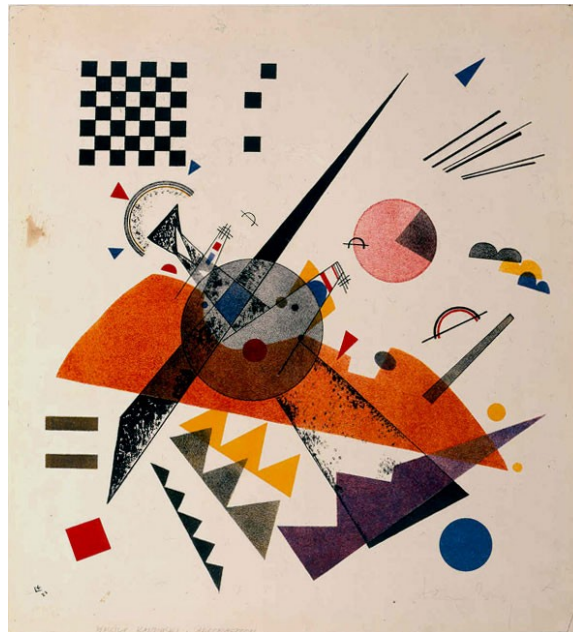
Orange (1923) Vasily Kandinsky

Tenen un grau d'iconicitat ZERO . No podem identificar cap element de la imatge com una representació directa de la realitat.