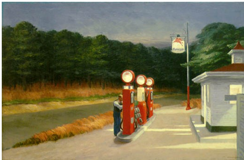
Gas (1940) Edward Hopper

Tenen un ALT grau d'iconicitat . Els elements de la imatge els podem reconèixer molt fàcilment degut a que són representacions mimètiques de la realitat. La imiten.